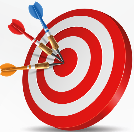
လေးစားစွာဖြင့်၊

ကျွန်ုပ်တို့ EA ဂျာနယ်၏ ဤ ၁၉ ကြိမ်မြောက်စာစောင် ကို နိဂုံးချုပ်လိုက်သည်နှင့်အမျှ ကျွန်ုပ်တို့၏ ကွဲပြားသောအမြင်များနှင့် မျှဝေထားသော ထိုးထွင်းသိမြင်မှုများအပေါ် တွေးတောဆင်ခြင်ထားကာ ထိရောက်သောအကျိုးရှိစေသောစေတနာထားရှိမှု တို့ကို ထည့်သွင်းထားကြောင်း တွေ့မြင်နိုင်မှာဖြစ်ပါတယ်။ ကျင့်ဝတ်ဆိုင်ရာ ထည့်သွင်းစဉ်းစားမှုများမှ လက်တွေ့ကျသော ဗျူဟာများအထိ၊ ဆောင်းပါးတစ်ခုစီသည် အပြုသဘောဆောင်သော အကျိုးသက်ရောက်မှုကို မည်ကဲ့သို့ မြှင့်တင်ရမည်ကို ကျွန်ုပ်တို့၏ စုပေါင်းနားလည်မှုကို အထောက်အကူဖြစ်စေနိုင်မှာပဲ ဖြစ်ပါတယ်။ ကျွန်ုပ်တို့သည် ကျွန်ုပ်တို့၏လုပ်ရပ်များကို ကရုဏာတရားနှင့် ဆင်ခြင်တုံတရားဖြင့် လမ်းညွှန်ပေးသည့် ကမ္ဘာတစ်ခုအတွက် ဆက်၍ ဇွဲနှင့်သန္နိဋ္ဌာန်ဖြင့် ဤသင်ယူမှုများကို ဆက်လက်လုပ်ဆောင်ကြပါစို့။ ဤတန်ဖိုးမဖြတ်နိုင်သော ဆွေးနွေးမှု၏ တစ်စိတ်တစ်ပိုင်းဖြစ်ရသည့်အတွက် အထူးပင်ကျေးဇူးတင်ရှိပါသည်။ သင်၏ အကြံပြုချက်၊ မှတ်ချက်များနှင့် မျှဝေထားသော အတွေ့အကြုံများက ကျွန်ုပ်တို့ကို နေ့စဉ် ပိုကောင်းလာစေရန် တွန်းအားပေးနေပါသည်။